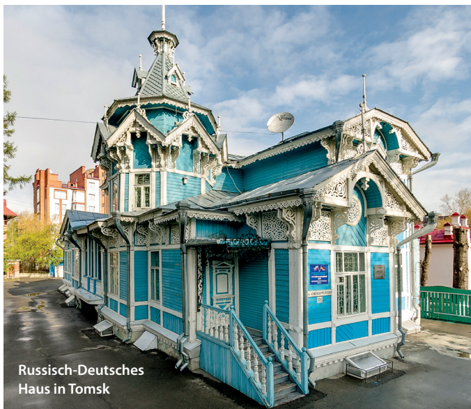
Russisch-Deutsches Haus in Tomsk

Findet statt im Rahmen der Tagung: „Russlanddeutsche in einem vergleichenden Kontext. Neue Perspektiven der Forschung/ Russian Germans in a Comparative Context: New Research Perspectives“, Vertretung des Landes Niedersachsen beim Bund, In den Ministergärten 10, 10117 Berlin , 18.–19. November 2015.